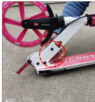
2: 用手捏合折叠板手, 注意操作的时候请放在地面操作, 尽量保持车杆自然放置, 不要用力压或者抬车杆。操作时候注意手的位置, 以免夹手。