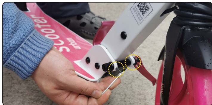
5: 如果用上方法都无法折叠,可以给折叠力度调松一点再操作。调节方法只需要用随车配送的最细的内六角板,往外拧如图的2个小顶丝,拧出来2MM左右即可。别拧太多,否则车打开固定之后折叠位置晃动间隙会变大。此处是调节车子打开和折叠的间隙,间隙越大越好操作折叠。如果车子打开之后,车杆前后晃动幅度大,也是这里2个小顶丝控制,可以拧紧一些顶丝就可以减小晃动。