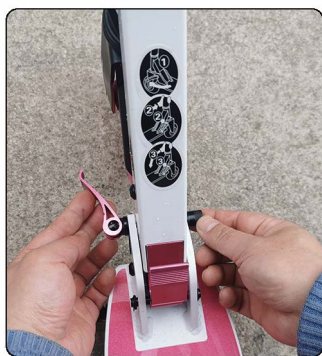
1: 打开脚踏板手,让脚踏保持松动。