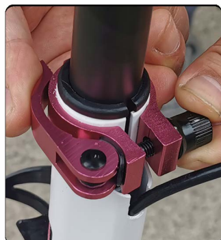
14: 重点: 拧紧高度锁扣螺丝之后, 如图正确的方向合上高度锁扣板手。确保它不会松动丢失。如果高度锁扣这里不锁紧, 会损坏车杆弹珠, 也可能造成滑行中车杆突然下滑。所以这个锁紧非常重要。调节高度之后不要忘记锁紧。