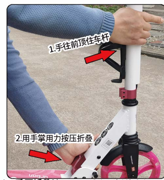
4: 手压折叠法: 一只手也是抓住车杆用力往前顶住车杆,和图2原理一样,保持推力的同时,使用另外一只手用手掌心用力按压折叠板手即可。如果按照图3和图4都太紧法折叠,可以按照图5的方法给折叠力度调松一点再重新操作折叠。