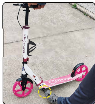
脚撑使用说明: 脚撑打开支撑状态下千万不要踩人上去, 脚撑只能承受车本身重量, 无法承受人踩在踏板上的重量, 如果使用的时候忘记收起脚撑, 会在无意间给脚撑踩变形, 导致脚撑角度变大翘起, 造成无法撑稳车身。如果脚撑角度太大, 可以稍微倾斜车身, 用脚往下轻踩脚撑, 让脚撑角度复原即可。

如果图文说明书看不懂可以扫车身折叠位置侧面的二维码, 就可以看到视频版操作说明, 根据视频操作即可。产品细节会因为批次不同不断升级改进, 请以实际到货为准。