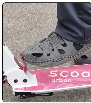
3: 脚踏折叠方法: 一只脚悬空用脚尖稍用力踢一下折叠板手即可,踢的时候一定悬空踢,脚不要踩到踏板上。脚踢不方便也可以用手掌心来用力按压折叠板手也可以。如图4所示的手压折叠。两种方法二选一即可。