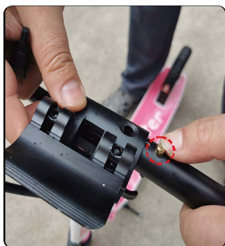
9: 按住车杆弹珠, 装入车头T杆, 让弹珠从车头对应的孔里面弹出来即可。