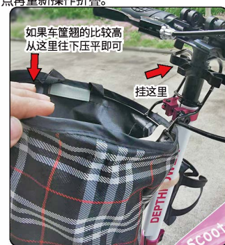
如果车筐翘的比较高从这里往下压平即可 挂这里