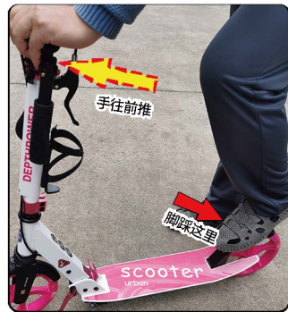
4: 用一只脚踩住后轮胎上的挡板保持车不会往前跑, 另外用双手抓住车杆往前推车杆, 推不动的时候保持不要松动, 然后再使劲用力往前推一下, 听到“啪”的一声, 然后人踩上车踏板, 车子不会折叠了, 表示打开锁定成功。