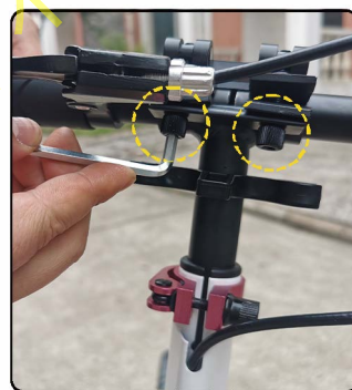
11: 合上压盖, 然后用内六角板手从压盖下面的螺丝孔拧紧压盖螺丝。注意: 本螺丝有防丢设计请勿强行完全拆下来, 只能拧紧。安装完毕如果车杆扶手有轻微晃动属于正常, 这样更方便折叠, 不影响使用安全。如果觉得不适应想要固定紧, 可以继续拧紧压盖螺丝, 直到手柄不晃动为止。