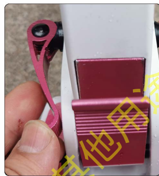
7: 正确的合上脚扣, 注意脚扣锁紧方向别错。掌握好松紧力度, 不要蛮力掰断脚扣。