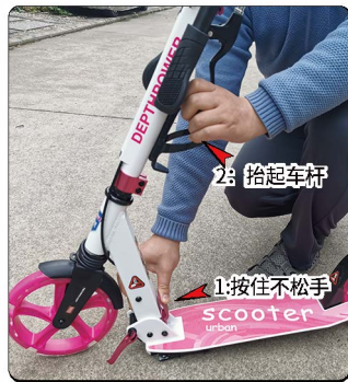
3: 完全捏合折叠板手之后保持不松手, 然后另外一只手往上抬起车杆。尽量压住折叠挡板别松开, 然后抬起车杆, 否则折叠挡板容易被蹭蹭掉漆。