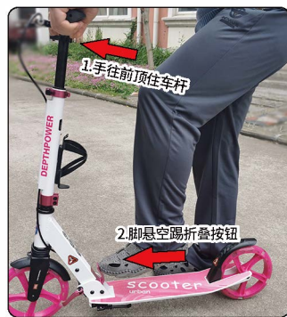
2: 重点: 双手往前推住车杆别松动【切记是往前推,如果是往后拉车杆就无法折叠】推车杆的时候也可以同时捏住手闸。推到感觉后轮要往上翘起来但是又没离开地面最好。