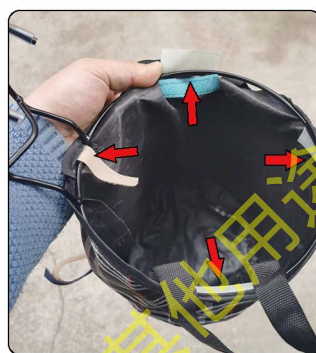
车筐只需要撕开布筐一圈魔术贴,给铁圈贴在魔术贴下面。然后挂在车杆的塑料8字扣上即可