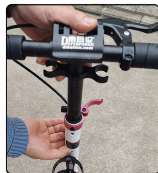
12: 调节高度: 先打开高度锁扣板手, 然后上提车杆, 如果提不动, 如图(13)检查车中杆上的弹珠孔里面其中一个孔是否有弹珠卡住, 同时一手按住弹珠, 另外一手就可以继续往上调节高度。降低高度也是一样的操作方法。