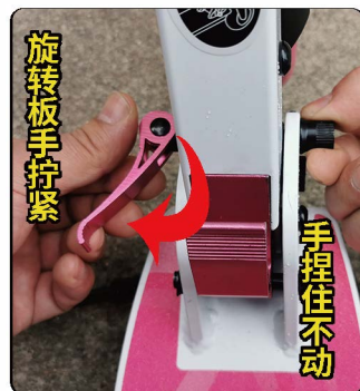
6: 完全打开到位车子可以正常滑行不会折叠之后。再锁紧脚扣。锁紧脚扣先用手捏住对面螺帽保持螺帽不动, 转动脚扣板手调到合适力度, 然后如图方向锁上脚扣即可。注意脚扣不要锁过紧以免折断。