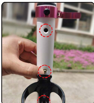
13: 调节到合适高度之后, 务必锁紧高度锁紧扣, 以免螺丝丢失或者车杆弹珠损坏。锁紧方法一只手捏住高度锁扣螺帽, 另外一只手完全打开锁扣板手, 然后转动板手让螺丝锁紧, 这里和锁紧脚扣方法一样。