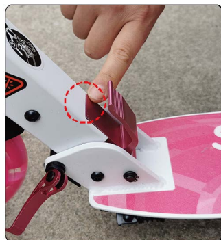
5: 检查折叠挡板和车身是否平齐, 如果完全平齐说明打开到位, 如果挡板比车身低下去, 表示打开还是不到位, 需要重新操作固定。否则使用的时候车子会固定不紧造成突然折叠。