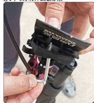
8: 掀起车头压盖, 用随车带的内六角板手从压盖中间撬出里面的塑料垫子, 此塑料垫子仅供发货防止车头变形使用, 到货安装之后可以丢弃。