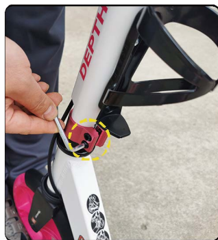
车头角度调节方法: 如果到货车头角度和轮胎夹角不正, 有点歪需要调节, 只需要先锁紧高度锁扣, 然后给如图所示的中管的2个固定螺丝拧松, 车头中管就可以360度旋转, 然后对正角度, 用力锁紧中管这2个固定螺丝即可。如果还会错位, 说明这2个螺丝锁紧力度不够, 可以找加长的板手用力锁紧到车头不会再错位为止。